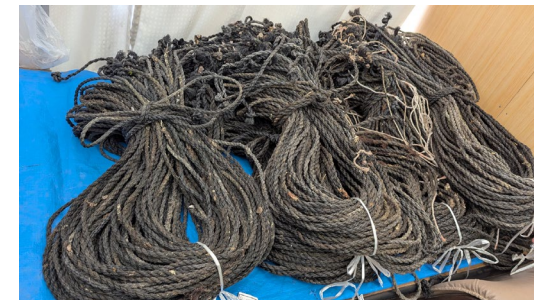
50本1束にまとめて 員数管理