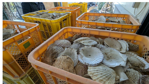
真ん中に穴をあけた帆立貝殻