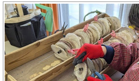
貝殻10枚ずつ洗濯ばさみで目印