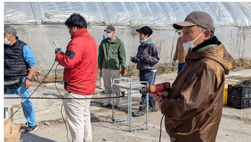
インパクトドライバーでロープを振り直す