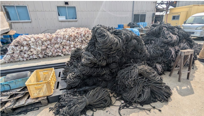
再生済みロープ納入品