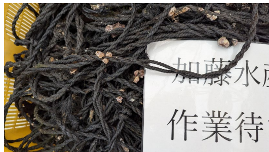
使用済みの牡蠣養殖ロープ