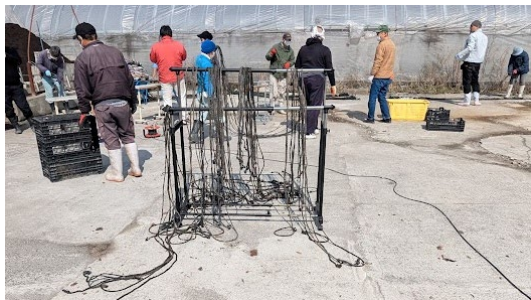
絡まないようにハンガー掛け