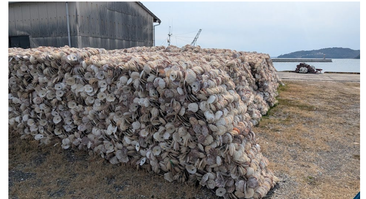
納入品は事業所員が積上げ整理