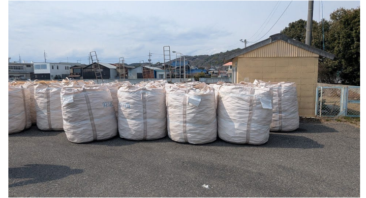
ホタテ貝殻(事業所員がリフトで積んで持ち帰る)