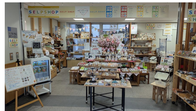
「ハレの福産良品」店舗